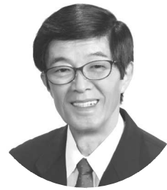
高村功議員 9月19日に質問