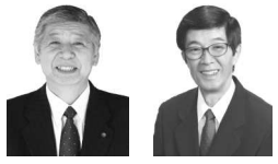
金子卓議員 高村功議員