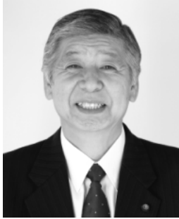
日本共産党 金子 卓 議員