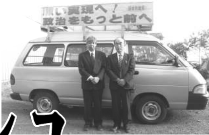
1月2日、市内全域を 新年のあいさつ

日本共産党市議団が要求し続けてきた「国保税の減免」を明記した条例改正が12月議会で決まりました。 今までは災害に限定されていたが、今回の改正で「倒産」「破産」「解雇」「失業」また「疾病・負傷などで就業できない場合」も対象になります。 実施は今年4月からです。対象者や減免の基準などの詳細は同条例の規則で決められます。詳細は